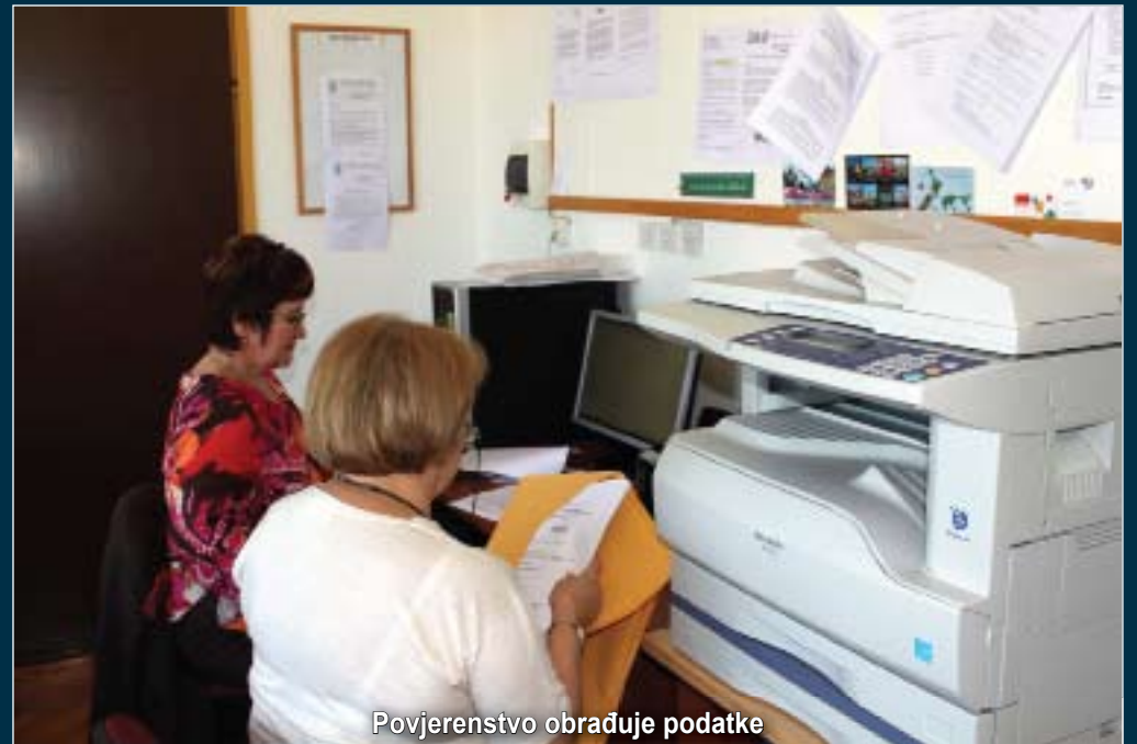
Povjerenstvo obrađuje podatke