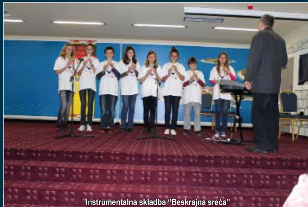
Instrumentalna skladba "Beskrajna sreća"