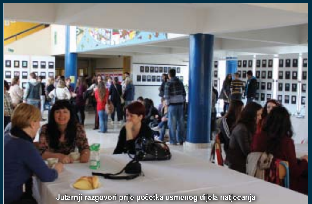
Jutarnji razgovori prije početka usmenog dijela natjecanja