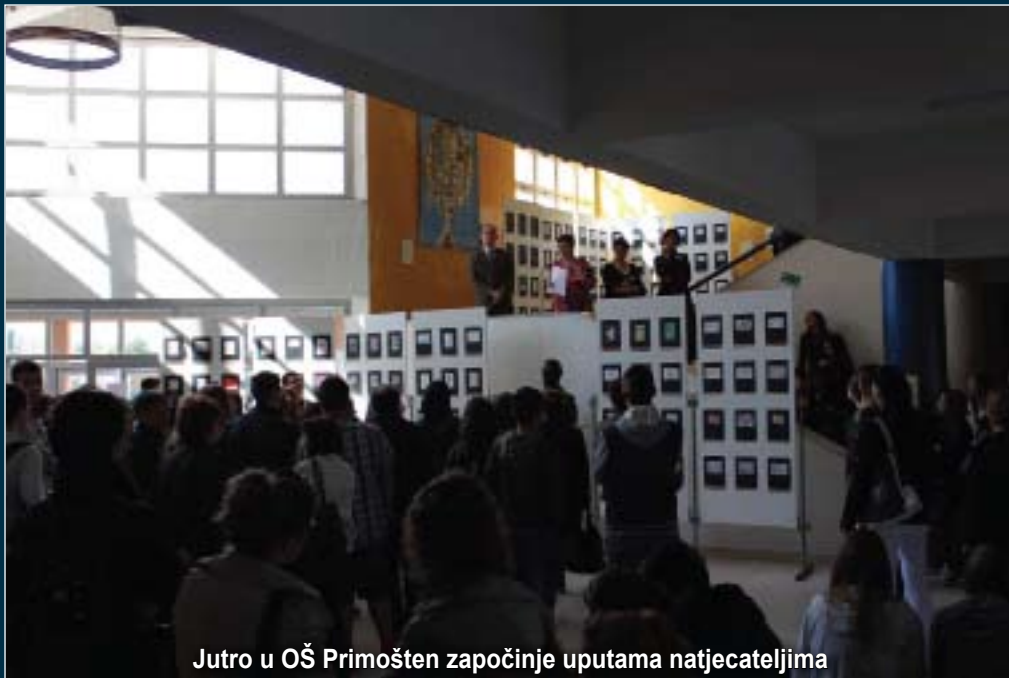
Jutro u OŠ Primošten započinje uputama natjecateljima