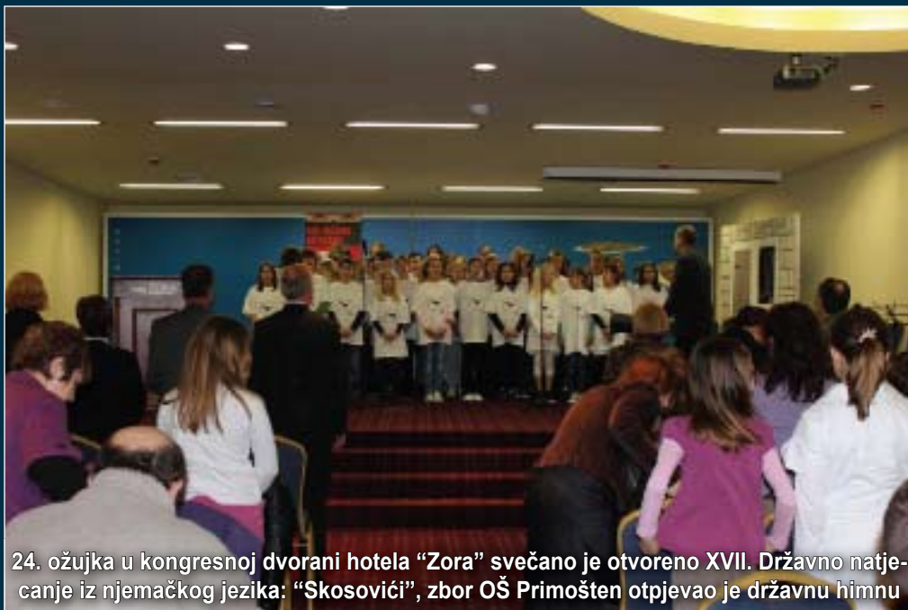
24. ožujka u kongresnoj dvorani hotela "Zora" svečano je otvoreno XVII. Državno natjecanje iz njemačkog jezika: "Skosovići", zbor OŠ Primošten otpjevao je državnu himnu