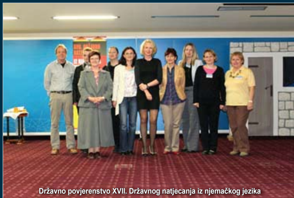
Državno povjerenstvo XVII. Državnog natjecanja iz njemačkog jezika