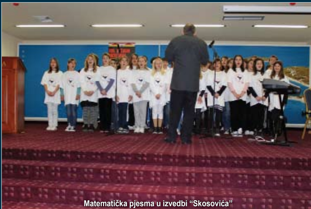
Matematička pjesma u izvedbi "Skosovića"