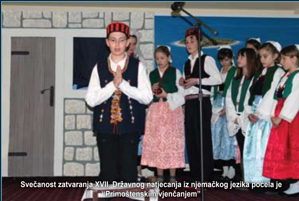
Svečanost zatvaranja XVII. Državnog natjecanja iz njemačkog jezika počela je "Primoštenskim vjenčanjem"