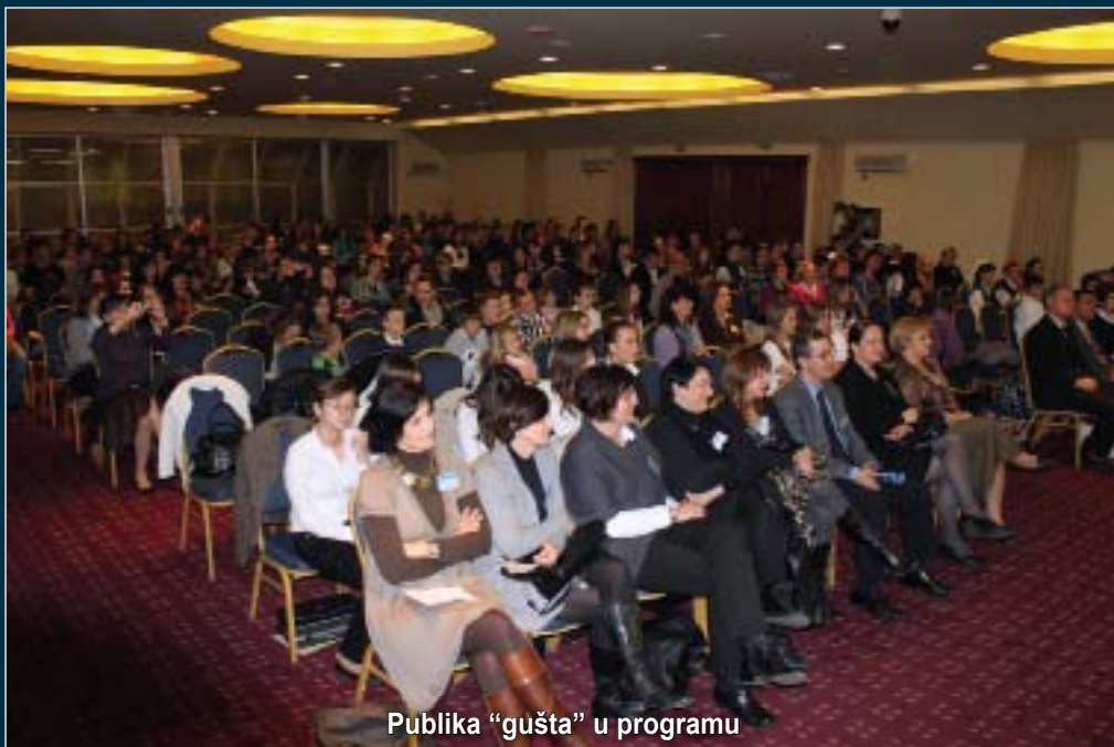
Publika "gušta" u programu