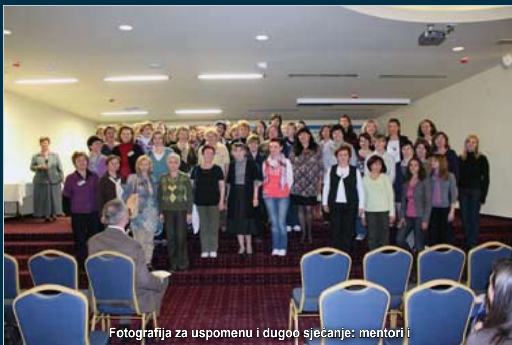
Fotografija za uspomenu i dugoo sjećanje: mentori i