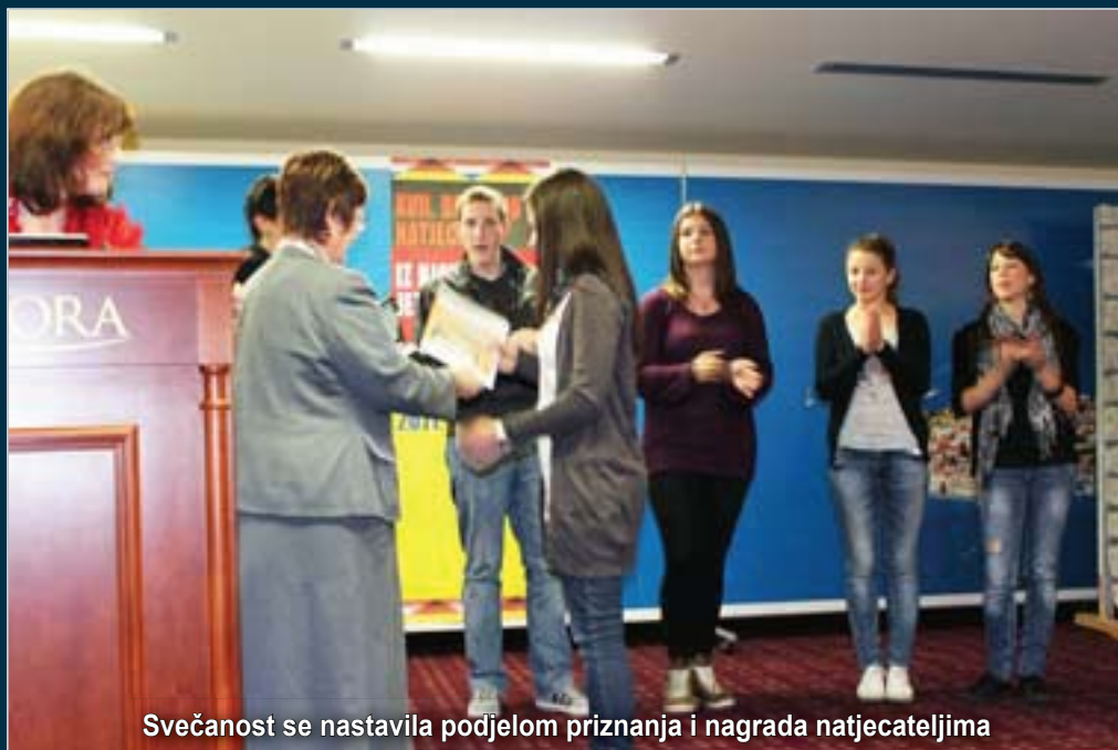
Svečanost se nastavila podjelom priznanja i nagrada natjecateljima