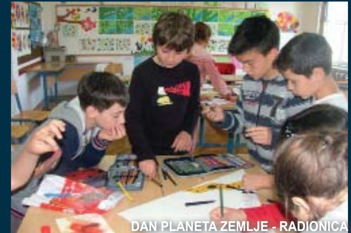
DAN PLANETA ZEMLJE - RADIONICA