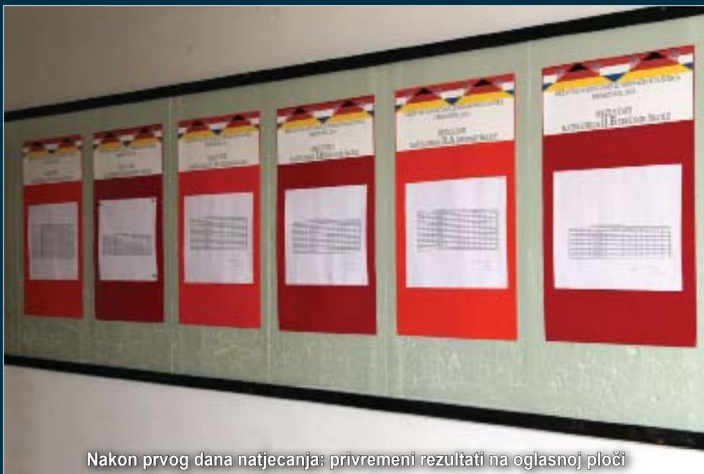
Nakon prvog dana natjecanja: privremeni rezultati na oglasnoj ploči